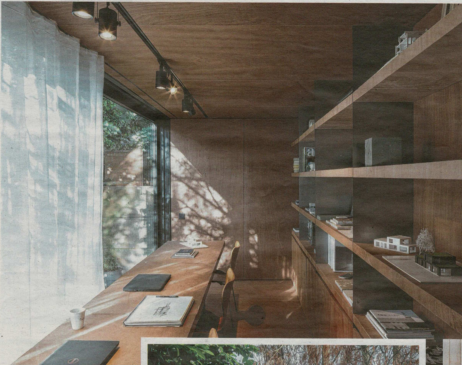
Binnen is veel gekozen voor multiplex als materiaal.

De binnenruimte bedraagt zo'n 28 vierkante meter.